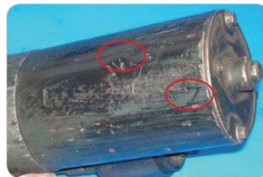
Nečitelné číslo, chybějící štítek