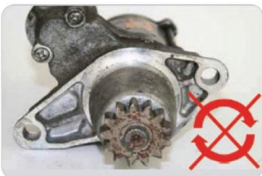
S hřídelí nelze otáčet