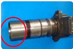
UP rozebrané nebo neúplné