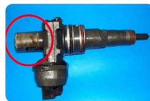
Rozebrané nebo neúplné