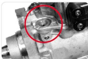
Poškozené závity na tělese čerpadla