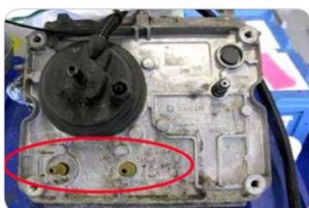
Chybějící záslepky na vývodech