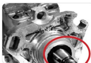
Poškození hnací hřídele a příruby, zbarvení způsobené přehřátím