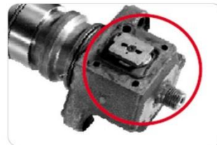
UI rozebrané nebo neúplné