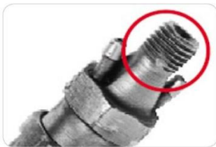
Poškození v závitech