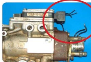
Poškozené dráty na domečku čerpadla