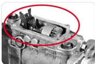
Čerpadlo rozebrané nebo neúplné